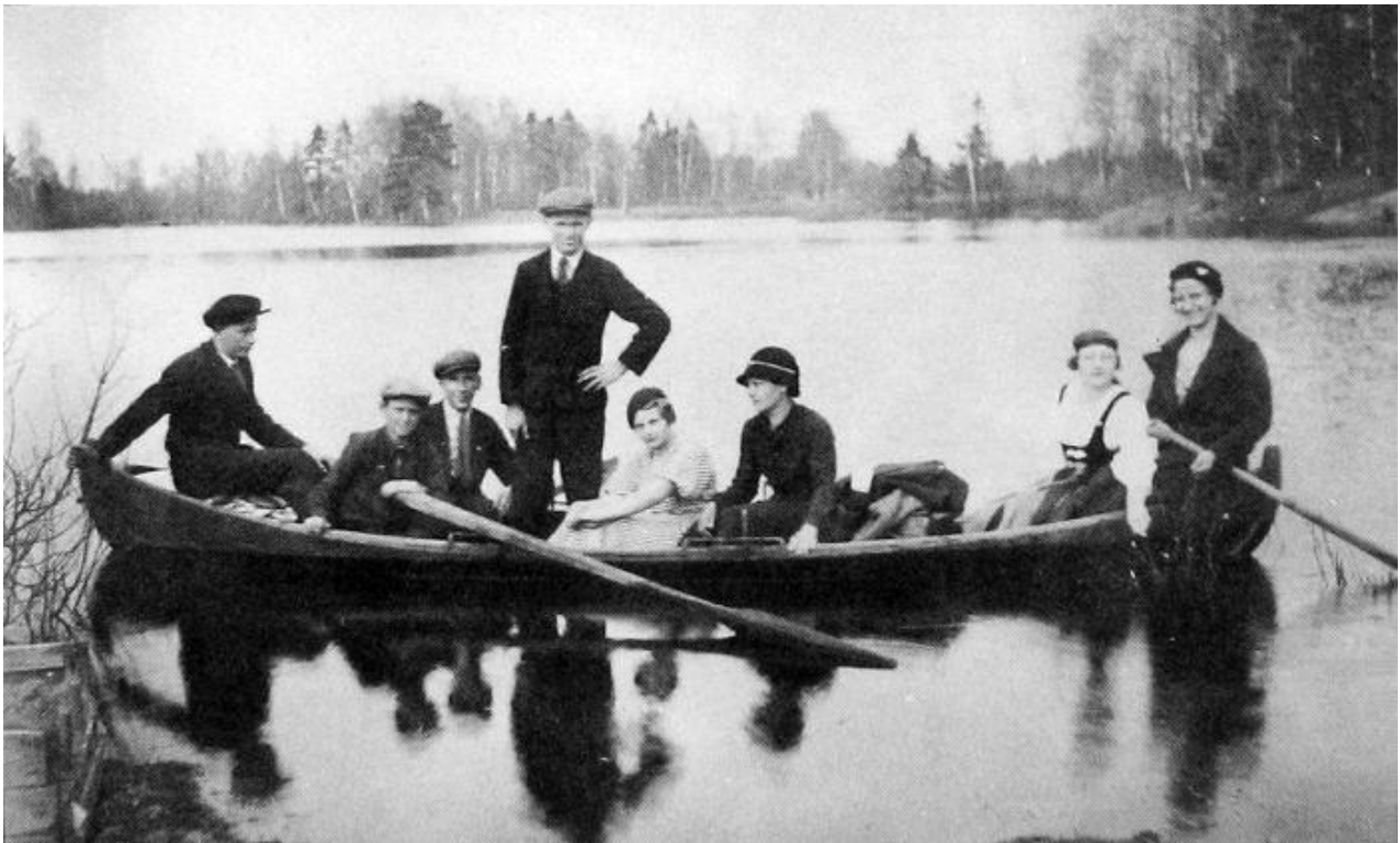
Nuoria Vuoksen vesillä.