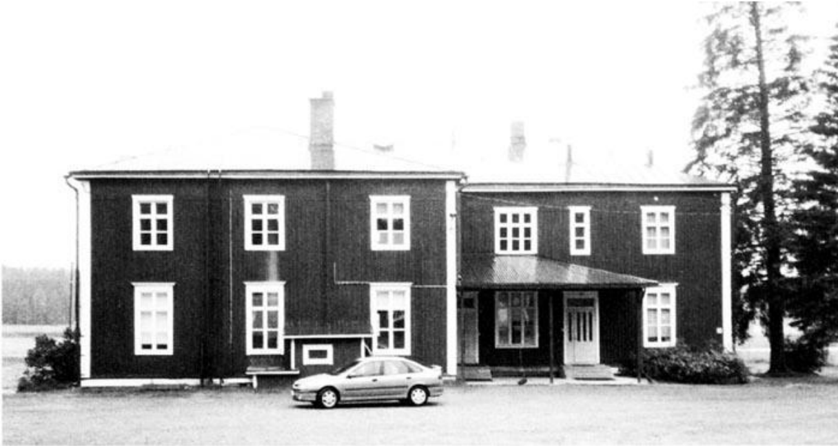
Tämän katon alla monen hirvisaarelaisen vanhuksen evakkotie päättyi. Kuvassa Ylistaron Uhtamalan kyläkoulu.

Kuitenkin oli pimeää, kun saavuimme Ylistaroon, määränpäähämme. Olisiko ollut sunnuntai? Kuorma-autoilla meidät vietiin asemalta Untamalan koululle. Lotat olivat valmistaneet meille lihasoppaa. Hieman outo elämys meille karjalaisille oli keitossa olevat "jauhoklimpiti". Pappi oli myös paikalla! Hän julisti meille Jumalan sanaa.