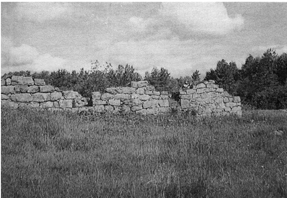
Suutarin navetan vankka kiviseinä uhmaa aikaa Sakkalin-niemellä.