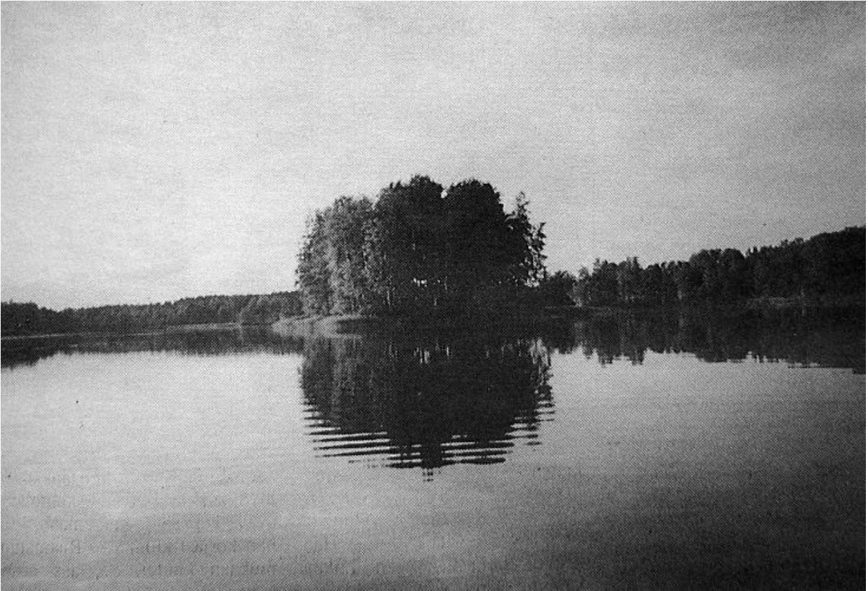
Sakkalinlahden kauneutta. Edessä Haapasaari, oikealla Sakkalinniemi.